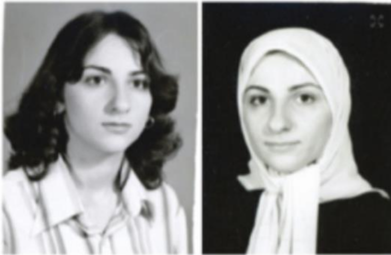
The combination photo shows the author and manager in Iran before the Islamic Revolution, left, and after